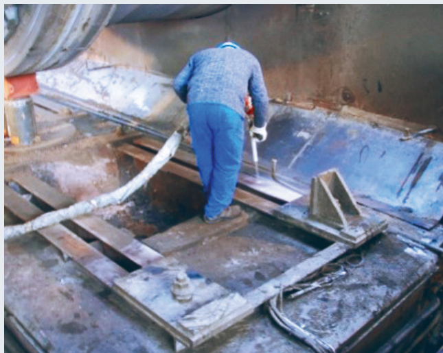
Ausbau der bisherigen Rolleneinheiten und Säubern der vorhandenen Sohlplatte. Arbeiten an der Sohlplatte und am Ofenfundament sind nicht notwendig.