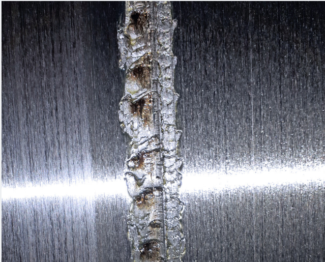
Schaden an einem Mühlenlaufring