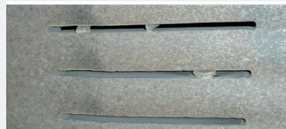
polalloy - Platte nach 14.100 Betriebsstunden