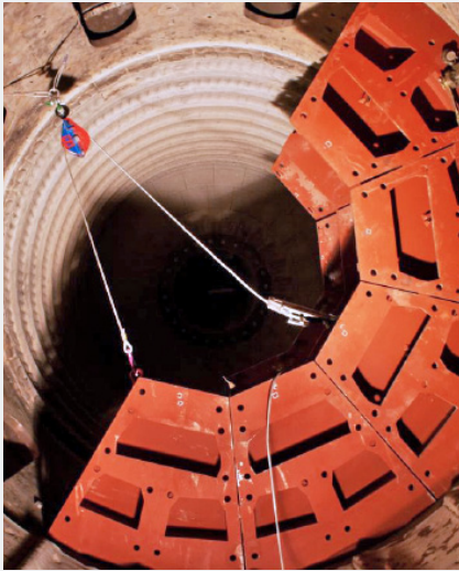
Montage des Wandgerüsts